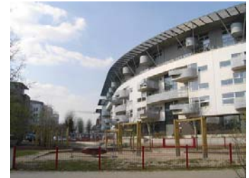
Wohnen auf Stralau