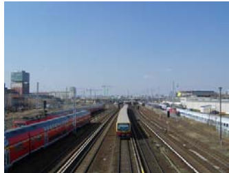
Reisen in den Westen